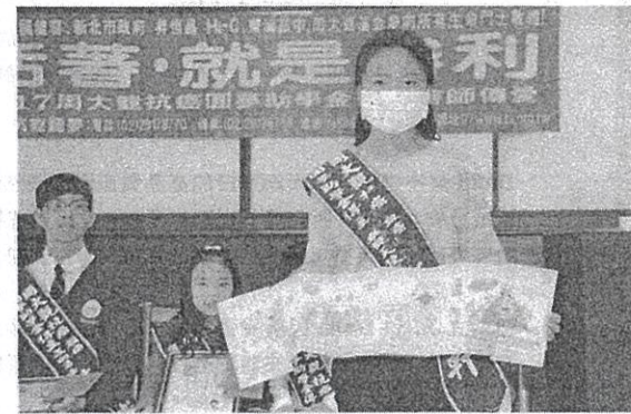
◀◀周大觀文教基金會28年來，從未曾間斷對抗癌孩子的關心、陪伴和服務，28年來已義助新台幣3億多元。

輔導到家庭輔導及照顧者支援、癌症適應、心理治療、生命教育相關課程。●另從大觀之友到伸展運動、單親癌童照顧關懷、療癒瑜